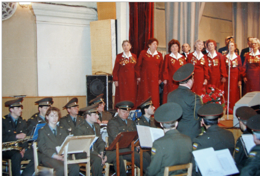
Выступление Петрозаводского хора ветеранов.

никумах, институтах, ПТУ, на предприятиях, в воинских частях, в доме престарелых, выезжали в город металлургов Костомукшу, Кандалакшу, Мурманск, Крошнозеро, Сегежу, Москву, Ленинград. Везде принимали тепло и с радостью, приглашали еще приезжать. Да и как иначе? Эти люди, прошедшие суровую кровавую бойню, с ранами и контузиями, находили силы не только для семьи, но еще и для людей, для молодежи, детей. Все они, убеленные сединой, производили огромное впечатление.