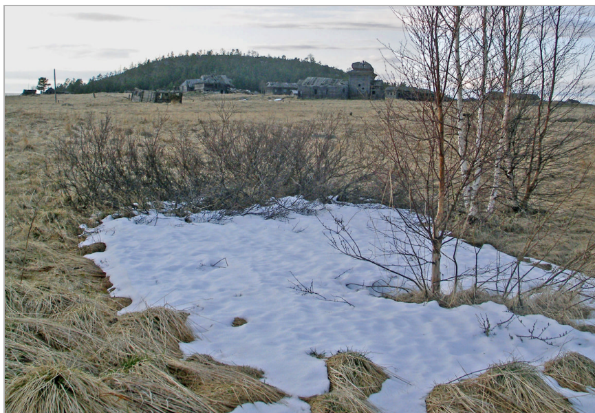
Унежма. Последний снег.

Люблю лето в Унежме! Чудные негаснущие вечера, белые ночи, незаходящее солнце пленит и чарует. Вечером под крышами